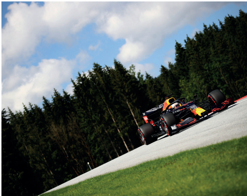
Verstappen humpelt beim Auftakt in die Garage; Flugeinlage der „Flying Bulls“ während der Startaufstellung; Regengott Hamilton pflügt durch steirische Pfützen.